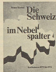
Bruno Knobel Die Schweiz im Nebelspalter Karikaturen 1875 bis 1974 2. Auflage 312 Seiten Fr. 49.—

Epigramme sind Singgedichte. Als Instrument satirischer Zeitkritik demaskieren diese Epigramme, was dem Autor auf dem weiten Feld menschlicher Unzulänglichkeit begegnet.