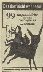
Felix Rorschacher Das darf nicht wahr sein 99 ungläubliche aber wahre Druckfehler und Stillblüten 90 Seiten Fr. 9.80

Diese imaginär-frechen Notizen eines Schweizer Buben brauchen keine weitere Empfehlung. Sie waren und sind immer wieder ein besonderes Lesevergnügen.