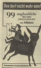
Felix Rorschacher Das darf nicht wahr sein 99 ungläubliche aber wahre Druckfehler und Stillblüten 90 Seiten Fr. 9.80

Diese imaginär-frechen Notizen eines Schweizer Buben brauchen keine weitere Empfehlung. Sie waren und sind immer wieder ein besonderes Lesevergnügen.