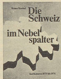
Bruno Knobel Die Schweiz im Nebelspalter Karikaturen 1875 bis 1974 2. Auflage 312 Seiten Fr. 49.—

Epigramme sind Singgedichte. Als Instrument satirischer Zeitkritik demaskieren diese Epigramme, was dem Autor auf dem weiten Feld menschlicher Unzulänglichkeit begegnet.