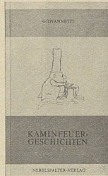
Giovannetti Kaminfeuer-geschichten 95 Seiten Fr. 11.50

Giovannettis «Kaminfeuer-geschichten» sind ausgezeichnete Lektüre für Freunde des Gehaltvollen. Und dort, wo sie entstanden, wollen sie auch gelesen werden: am Kamin. Wobei Kamin nicht wörtlich genommen werden muss. Es genügt eine stille Ecke.