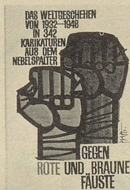
Bö und Mitarbeiter Gegen rote und braune Fäuste 342 Zeichnungen aus den Jahren 1932 bis 1948 Taschenbuch-Mehrfachband 352 Seiten Fr. 10.80

Mit vordergründigem Charme und hintergründigem Witz lässt Wolf Barth Bilder sprechen – federleicht und gedankenschwer: Spruchweisheit springt ins Auge.