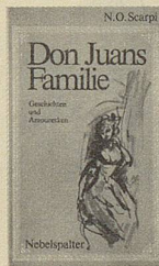
N. O. Scarpì Don Juans Familie Geschichten und Amouresken Illustrationen Helmut Knorr 184 Seiten Leinenband Fr. 19.80

53 Gedichte ohne Vor- und Nachwort, treffend unterstrichen durch Illustrationen von Barth. Menschsein ist ein harter Beruf und doch zuweilen heiter. Vergnügliches Bewusstmachen des Treitmühdaseins, aufgelockert durch Gedanken und Wortspielereien.