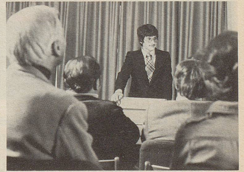
Momente höchster nervlicher Spannung: Der erste Vortrag. Da bewähren sich Zeller Entspannungs-Dragees