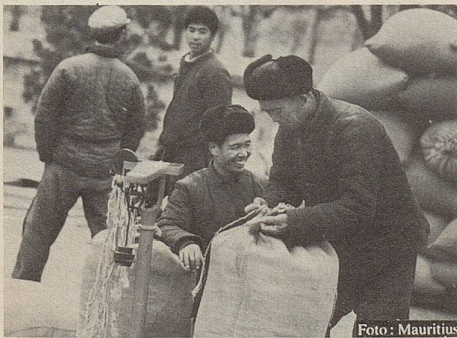
Versteigerung heilkräftiger Kräuter auf einem orientalischen Markt