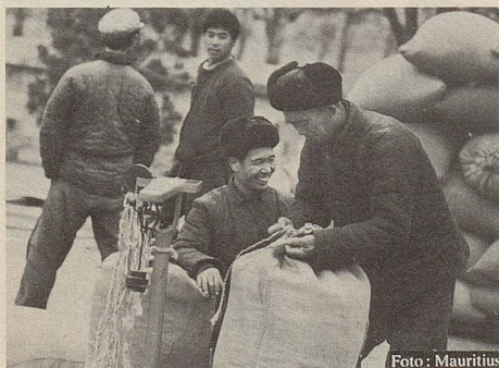
Versteigerung heilkräftiger Kräuter auf einem orientalischen Markt