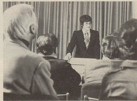
Momente höchster nervlicher Spannung: Der erste Vortrag. Da bewähren sich Zeller Entspannungs-Dragees