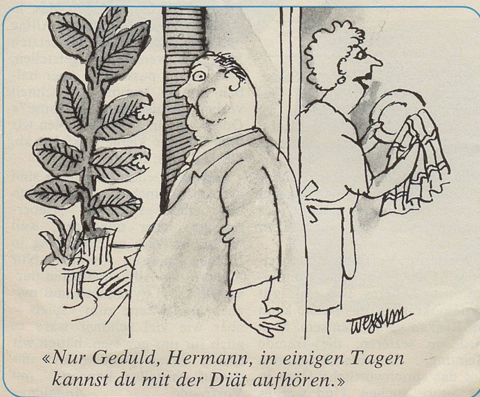
«Nur Geduld, Hermann, in einigen Tagen kannst du mit der Diät aufhören.»

Etwas sehr Positives kommt dazu: Jeder Künstler verpflichtet sich, einen Tag ganz den Schülern zu widmen. In allen Klassen spricht er über seine Arbeit, seine