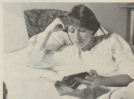
Wenn der Schlaf flieht, können Zeller Herz- und Nerven-Dragees für die wohlthuende Ruhe sorgen.