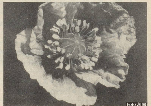
Flos Rhoeados (Klatschmohn), eine der elf Heilpflanzen im Zellerbalsam.