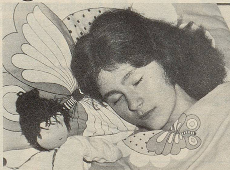
Zeller Herz- und Nerven-Dragees helfen, endlich wieder schlafen zu können wie als Kind.