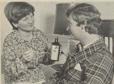
Der Rat des Arztes ist nicht zu ersetzen. Das gilt auch für die Medikation von Herz- und Kreislaufbeschwerden.