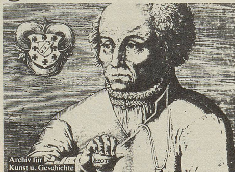
Theophrast von Hohenheim, gen. Paracelsus, der grosse Arzt und Naturforscher, kannte und nutzte die Heilkraft der Kräuter.

Gegen nervöse Herz- und Kreislaufbeschwerden (Herzklopfen, Beklemmungsgefühl), gegen Nervo- sität, Angstgefühl, nervöse Atemnot sind mehrere Medizinalkräuter gewachsen: Crataegus (Weiss- dorn), Passiflora, Strobili Lupuli und andere. Die bewährtesten von ihnen finden sich in Zeller Herz- und Nerventropfen . In harmonischer Ergänzung ihrer Wirkungsbereiche beruhigen sie Herz und Nerven. Ohne die Gefahr einer Gewöhnung können Zeller Herz- und Nerventropfen über längere Zeit eingenommen werden. Stellt sich jedoch nicht bald Besserung ein, so ist der Arzt zu konsultieren. – Auch als Dragées erhältlich.