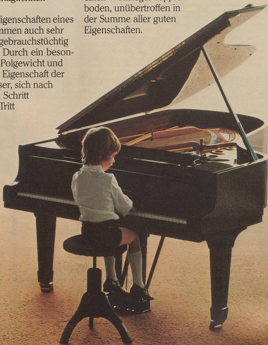
Das Foto: Ein Wollsiegel-Teppichboden, Art. cabana Emir, Farbe d'beige, von Loppacher & Co. AG, 9100 Herisau.