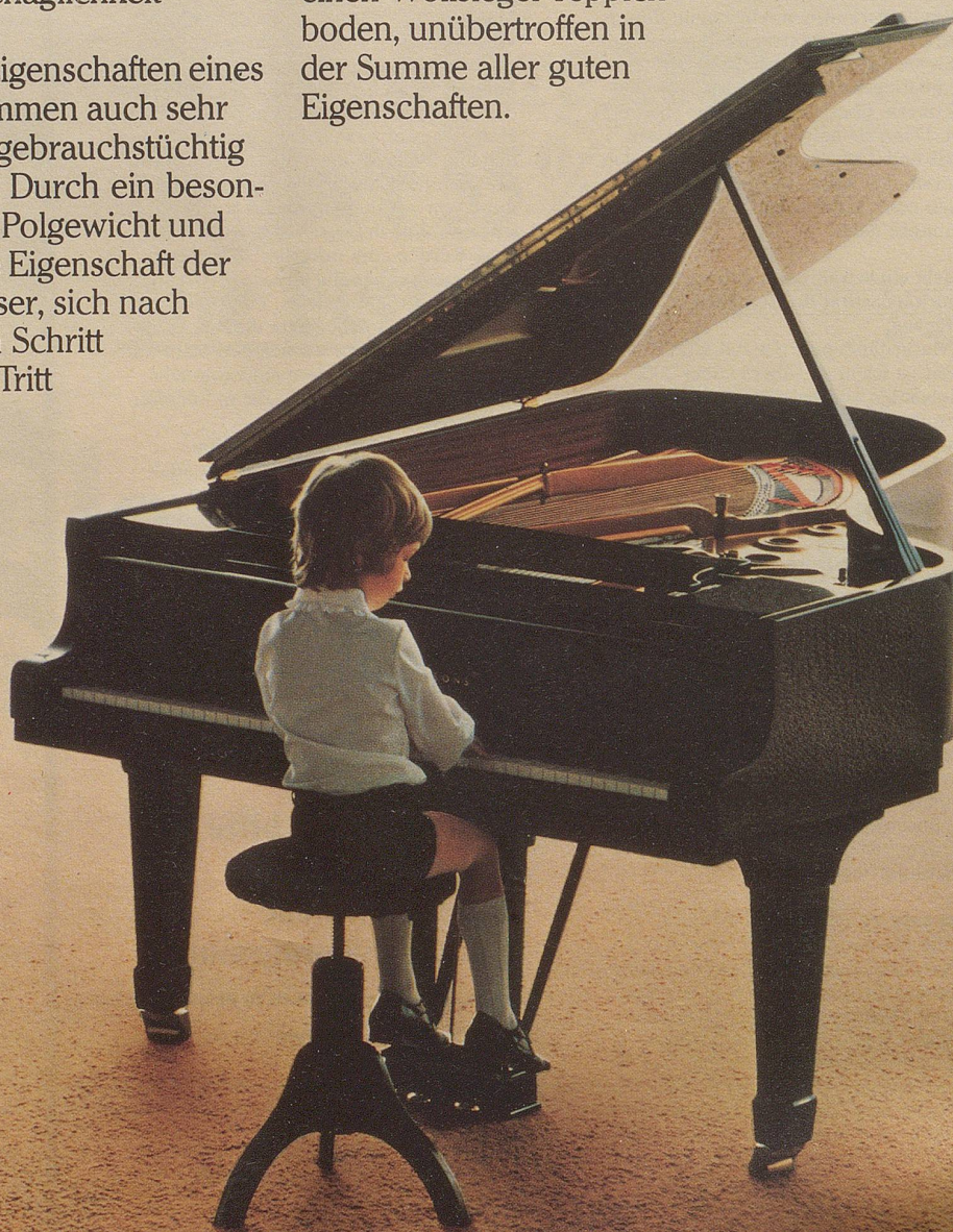
Das Foto: Ein Wollsiegel-Teppichboden, Art. cabana Emir, Farbe d'beige, von Loppacher & Co. AG, 9100 Herisau.