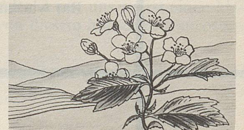
Fructus Crataegi, eine der Heilpflanzen, deren Extrakte in Zellers Herz- und Nerventropfen enthalten sind (nach Prof. Hörhammer).

Naturkräfte der Pflanzen werden auch wohltuend aktiv bei Herzklopfen, raschem Puls, Beklemmungsgefühl, bei Nervosität, Reizbarkeit und Atemnot. So verdanken Zellers Herz- und Nerventropfen ihre Heilerfolge unter anderem Extrakten aus Blüten, Blättern und Früchten des Crataegus (Weissdorn). Zellers Herz- und Nerventropfen besänftigen die gereizten Nerven und lassen das Herz wieder ruhiger schlagen.