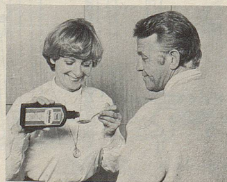
Zellerbalsam – seit über hundert Jahren das Hausmittel gegen Magen- und Darmbeschwerden.

Sein Rat ist nicht zu ersetzen. Wenn Sie sich fragen, ob Sie bei einem Unwohlsein besser Ihren Arzt aufsuchen sollten, tun Sie es!