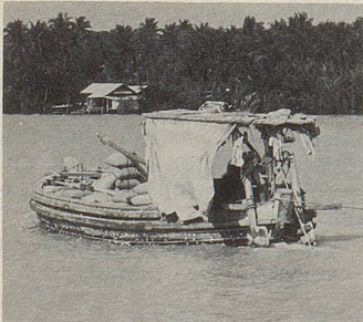
Transport von Heilpflanzen auf dem Menam (Thailand).

In Zellers pflanzlichen Arzneien stecken Kräfte der Natur. In wert-erhaltendem Verfahren und in immer