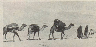
Auf „Wüstenschiffen“ werden Heilkräuter zum Hafen gebracht.

Qualität und nachweisbarer Wirksamkeit. Bei vielen Beschwerden helfen sie.