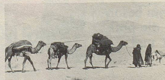
Auf „Wüstenschiffen“ werden Heilkräuter zum Hafen gebracht.

Qualität und nachweisbarer Wirksamkeit. Bei vielen Beschwerden helfen sie.