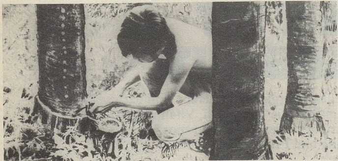
In Siam wird aus Einschnitten in die Stammrinde einer Styracaceae ein wichtiger Bestandteil des Zellerbalsam gewonnen.

Wohnkaleidoskop Urs Hess Gerechtigkeitsgasse 35, Bern