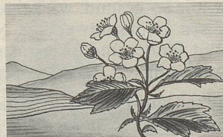
Crataegus, eine der Heilpflanzen, deren Extrakte in Zellers Herz- und Nerventropfen enthalten sind.

Zellerbalsam bewährt sich nun bereits seit über hundert Jahren. Er ist jetzt auch in Tablettenform erhältlich.