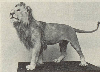
Eggenschwylers «Zürileuli» ausgestopft; es lebte von 1902 bis 1905 in Zürich.

ausgestopft noch immer vorhan-den. Eggenschwyler betreute es daheim, meldete in der Zeitung, das Tier gehe «von einem Zim-mer in das andere und horcht, auf welchem Bett der grosse An-gora-Kater schläft, dann klettert er hinauf und der Kater verlässt fauchend sein Nest und das g'schide chline Leuli legt sich schnellstens exact in den wei-chen, warmen Trichter, den der schwarze Kater in die Bettdecke gedrückt hat. Ist das nicht ein richtiger Züribieter?» Später ging die Freude der Zürcher am Züri-leuli zurück, weil Eggenschwyler mit dem mittlerweile ausgewach-senen, freilich zahmen Löwen durchs Niederdorf bummelte, das Tier an einer Leine führend. Der Polizeivorstand klemmte diese Promenaden ab, der Löwe durfte nur noch hinter Gittern gezeigt werden. Eggenschwyler dazu un-gnädig: «Die Zürcher sind doch Furchthasen.»