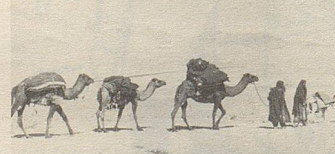
Auf „Wüstenschiffen“ werden Heilkräuter zum Hafen gebracht.

Qualität und nachweisbarer Wirksamkeit. Bei vielen Beschwerden helfen sie.