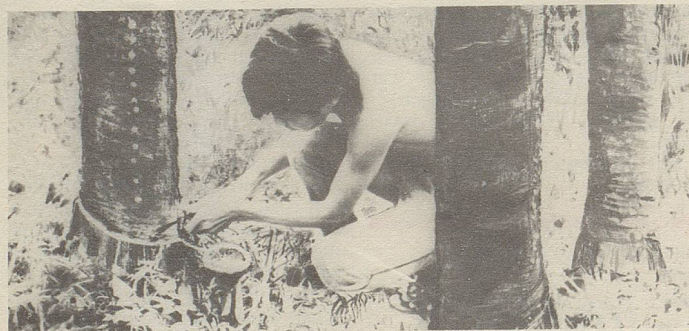
In Siam wird aus Einschnitten in die Stammrinde einer Styracaceae ein wichtiger Bestandteil des Zellerbalsam gewonnen.