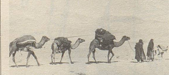
Auf „Wüstenschiffen“ werden Heilkräuter zum Hafen gebracht.

Qualität und nachweisbarer Wirksamkeit. Bei vielen Beschwerden helfen sie.