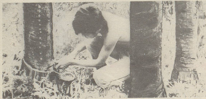
In Siam wird aus Einschnitten in die Stammrinde einer Styracaceae ein wichtiger Bestandteil des Zellerbalsam gewonnen.