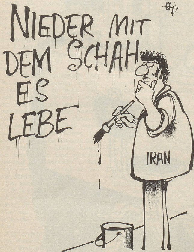
«... ja, wer eigentlich?»