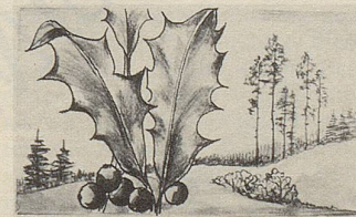
Ilex — eine der wirksamen Heilpflanzen in Zellers Herz- und Nerventropfen.

Wer kennt das nicht: Nervöse Spannungen, Unruhe, nervöse Reizbarkeit, Wetterfühligkeit, Lampenfieber vor Examen und wichtigen Besprechungen. Gegen diese Spannungszustände gibt es eine rein pflanzliche Arznei: