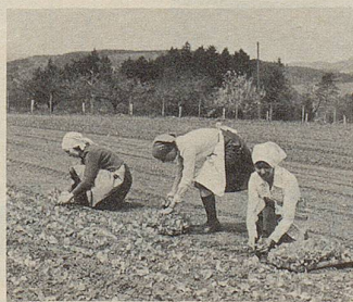
Ein Arzneipflanzenfeld wird geerntet.

Hier können Pflanzenkräfte helfen. Im Zellerbalsam sind die Säfte von