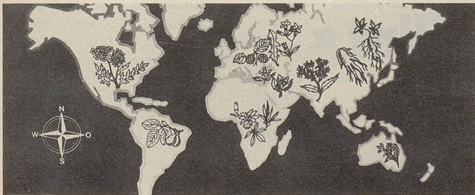
Pflanzen von allen Kontinenten in Zellers Heilmitteln.

8 Hits, 9 si, 10 UT, 11 Tito, 12 Aa, 13 Esse, 14 Od, 15 Bem, 16 After, 17 Rom, 18 soirée, 19 Uakari, 20 Ido, 21 Passe, 22 Aes, 23 ee, 24 Esse, 25 Id, 26 Earl, 27 Ri, 28 Go, 29 Eden, 30 La Cava, 31 innig, 32 Eta, 33 Amme, 34 Ehe, 35 nebelig, 36 Bern.