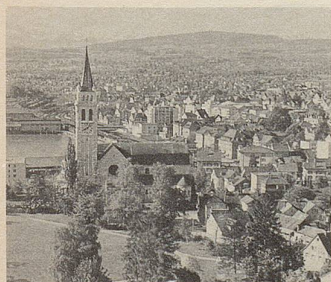
Romanshorn – hier wurden schon vor 120 Jahren rein pflanzliche Zeller-Arzneien entwickelt.

Cinnamomum aus Ceylon, Mohnblüten aus Sizilien, Guajak aus Haiti ... von allen Kontinenten kommen die Pflanzen, deren Extrakten Zeller-Arzneien ihre Heilkraft verdanken. In Romanshorn werden sie zu Heilmitteln von höchster Beständigkeit verarbeitet. Bei vielen Beschwerden bewähren sie sich seit Jahren.