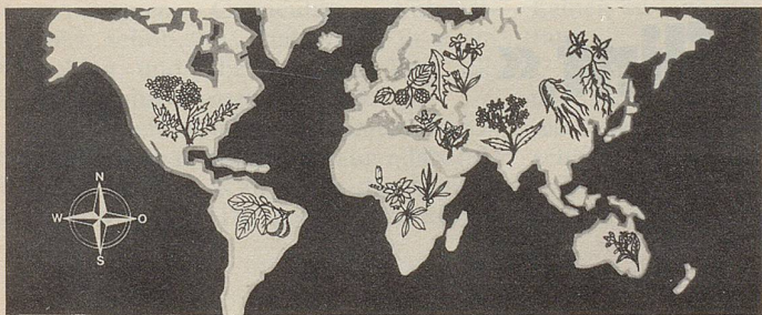
Pflanzen von allen Kontinenten in Zellers Heilmitteln.

8 Hits, 9 si, 10 UT, 11 Tito, 12 Aa, 13 Esse, 14 Od, 15 Bem, 16 After, 17 Rom, 18 soirée, 19 Uakari, 20 Ido, 21 Passe, 22 Aes, 23 ee, 24 Esse, 25 Id, 26 Earl, 27 Ri, 28 Go, 29 Eden, 30 La Cava, 31 innig, 32 Eta, 33 Amme, 34 Ehe, 35 nebelig, 36 Bern.