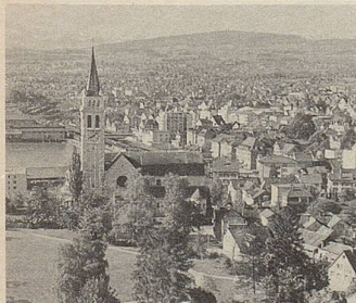
Romanshorn - hier wurden schon vor 120 Jahren rein pflanzliche Zeller-Arzneien entwickelt.

Cinnamomum aus Ceylon, Mohblüten aus Sizilien, Guajak aus Haiti ... von allen Kontinenten kommen die Pflanzen, deren Extrakten Zeller-Arzneien ihre Heilkraft verdanken. In Romanshorn werden sie zu Heilmitteln von höchster Beständigkeit verarbeitet. Bei vielen Beschwerden bewähren sie sich seit Jahren.