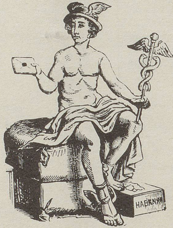
gehorsamst Partagas y Ca.

Sehen Sie, bei unseren Partagas -Cigarren sind Gärung (jajohl, Fermentation), Altern, Conditionierung, Ablagerung, von der Sortenmischung gar nicht zu reden – kurz alles Zeitraubende und Mühevolle – unter idealen Bedingungen bereits von