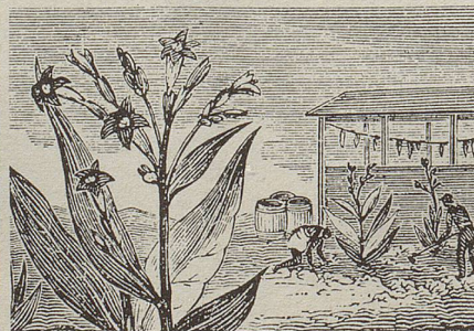
Geheimnis: Klima, Boden, Tabaksorte.

Nein, nein, besuchen Sie lieber immer wieder an einem Tage Ihrer Wahl besagten Leibleferanten. Partagas -Hand-Made-Ci-