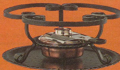
2123-4 Firestar-Rechaud, Gestell und Untersatz aus Schmiedeisen, Brenner aus Kupfer