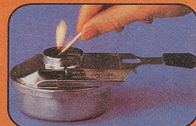
Brenner schliessen und anzünden