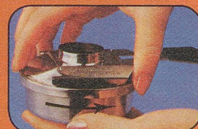
Brenner öffnen (Drehverschluss)