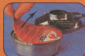
Packung mit Firestar-Brennpaste einlegen. Deckel aufreissen.