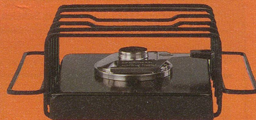
2150-6 Firestar-Rechaud, rechteckige Form 28x20 cm, Rost und Griffe aus rostgeschütztem Schmiedeisen schwarz, Unterteil aus schwarzem Stahlblech, herausnehmbar, Brenner aus Chromnickelstahl 18/10