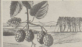
Hopfen enthält Herz und Nerven beruhigende Wirkstoffe (nach Prof. Hörhammer).

Eine Behandlung mit Zellers Herz- und Nerventropfen kann Ihnen helfen. Diese bewährte Arznei verdankt ihre beruhigende und