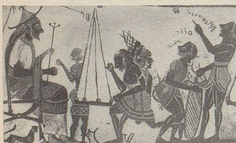
Wertvolle Pflanzen! König Arkiselaos von Kyrene (565 v. Chr.) beaufsichtigt das Wiegen von Heilkräutern (zeitgen. Darstellung).

Linderung und Heilung von Krankheiten aller Art suchten und fanden die Menschen seit jeher in den Kräften des Pflanzenreichs. Nach jahrhundertelanger Entwicklung präsentieren sich heute Extrakte aus Heilpflanzen als moderne und mildwirkende Arzneien, exakt in der Dosierung, gleichbleibend in der Qualität. Zeller bietet solche pflanzlichen Heilmittel gegen vielerlei Beschwerden.