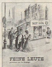
Feine Leute gezeichnet von Oto Reisinger

Man kann René Fehr, dem Clown unter den Nebelspalter-Karikaturisten, auch dort nicht böse sein, wo er selber sehr böse, frech oder gar makaber ist. Man —, denn irgendwann kommen wir alle einmal dran in seinen Cartoons.