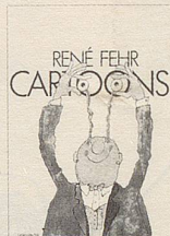
René Fehr Cartoons

112 Seiten mehrfarbig Grossformat Fr. 24.—