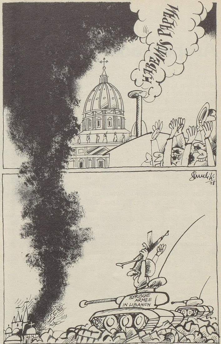
«Weisser Rauch – schwarzer Rauch»

«Nun... wenn er nicht läuten sollte, brauchen Sie ihn nur zu schütteln. Dann läutet er schon», erklärt die Wirtin.