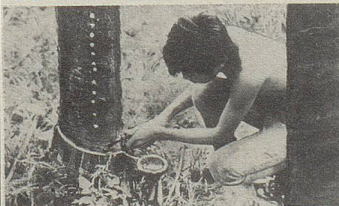
In Siam wird aus Einschnitten in der Stammrinde einer Styracaceae ein wichtiger Bestandteil des Zellerbalsam gewonnen.

Wenn Magen und Darm gegen reichliche und ungewohnte Kost mit Übelkeit, Krämpfen und Völlegefühl protestieren, dann bewährt sich Zellerbalsam.