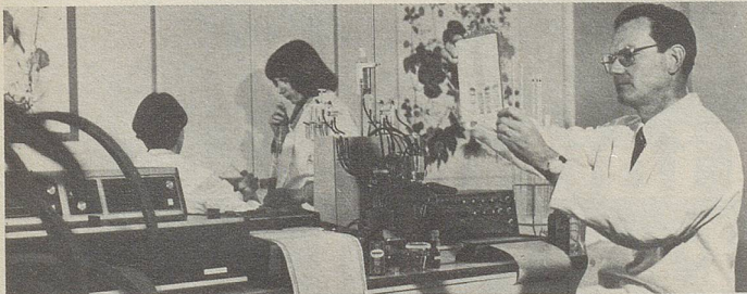
Mit Hilfe der Dünnschicht-Chromatographie werden Heilpflanzen-Extrakte analysiert.