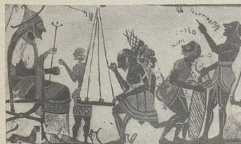
Wertvolle Pflanzen! König Arkiselaos von Kyrene (565 v. Chr.) beaufsichtigt das Wiegen von Heilkräutern (zeitgen. Darstellung).

Linderung und Heilung von Krankheiten aller Art suchten und fanden die Menschen seit jeher in den Kräften des Pflanzenreichs. Nach jahrhundertelanger Entwicklung präsentieren sich heute Extrakte aus Heilpflanzen als moderne und mildwirkende Arzneien, exakt in der Dosierung, gleichbleibend in der Qualität. Zeller bietet solche pflanzlichen Heilmittel gegen vielerlei Beschwerden.