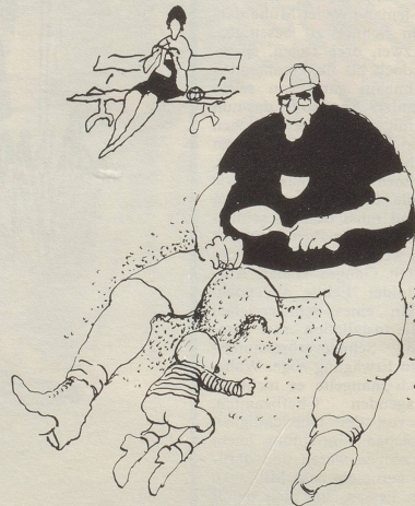
Den Spielgefährten der Kinder ist besondere Aufmerksamkeit zu schenken.