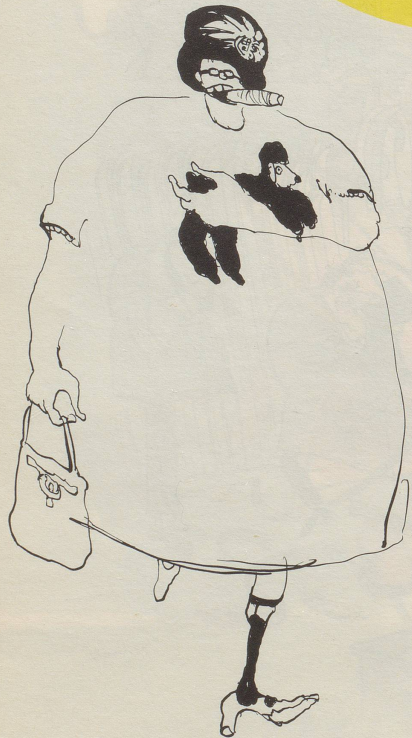
Die Verkleidung ist täglich zu wechseln.