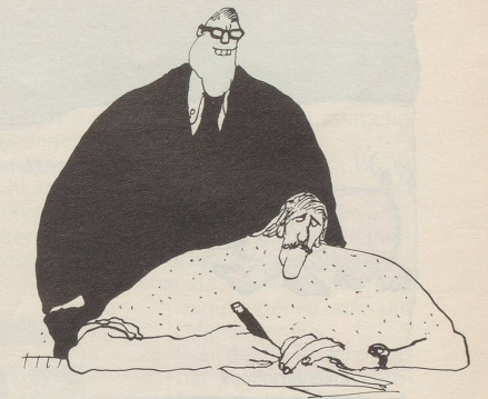
Falls ein Lösegeld bezahlt wird: Quittung verlangen! (Es ist angenehm, zum Beispiel 10 Millionen Franken von den Steuern abziehen zu können.)