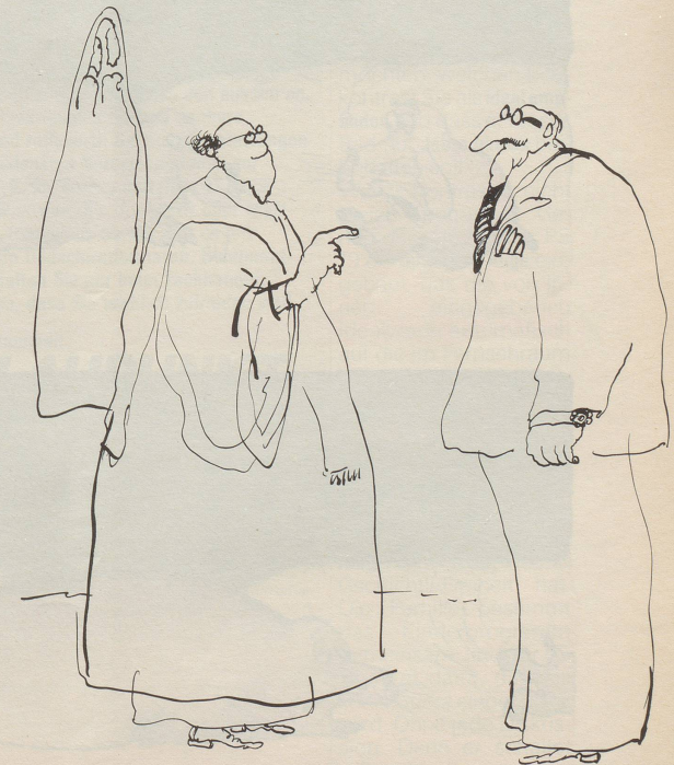
«Ohne .Gorilla. können wir Sie auch hier oben nicht aufnehmen!»