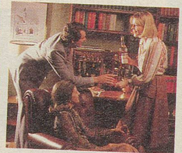
CAMPARI – oder gibt es eine nettere Begrüssung?