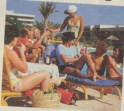
Jeder hat seine Ferien-Erinnerungen.