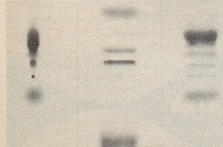
Eine exakte Analyse pflanzlicher Extrakte ermöglicht die Dünnschicht-Chromatographie.