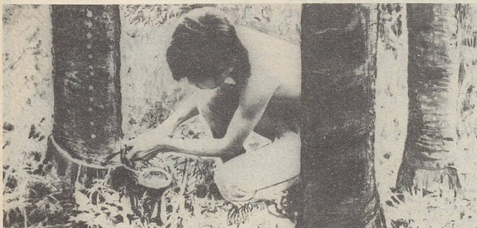
In Siam wird aus Einschnitten in die Stammrinde einer Styracaceae ein wichtiger Bestandteil des Zellerbalsam gewonnen.

Senkrecht: 1 Verweser, 2 Dia, 3 AR, 4 ist, 5 Ulema, 6 Grat, 7 Ahn, 8 Rm, 9 Rimsa, 10 Ep., 11 Jumbo, 12 Narr, 13 Erb, 14 Bedretto, 15 Maat, 16 Pfad, 17 um, 18 Anna, 19 Oeri, 20 PE, 21 Lid, 22 Assagais, 23 Sauna, 24 Ster, 25 Halme, 26 z. E., 27 Dorn, 28 Ulm, 29 oe, 30 in, 31 die, 32 Albis, 33 Eunuchen, 34 Ito.