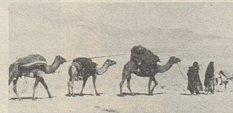
Auf „Wüstenschiffen“ werden Heilkräuter zum Hafen gebracht.

Qualität und nachweisbarer Wirksamkeit. Bei vielen Beschwerden helfen sie.