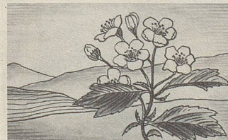
Crataegus, eine der Heilpflanzen, deren Extrakte in Zellers Herz- und Nerventropfen enthalten sind.

Zellerbalsam bewährt sich nun bereits seit über hundert Jahren. Er ist jetzt auch in Tablettenform erhältlich.