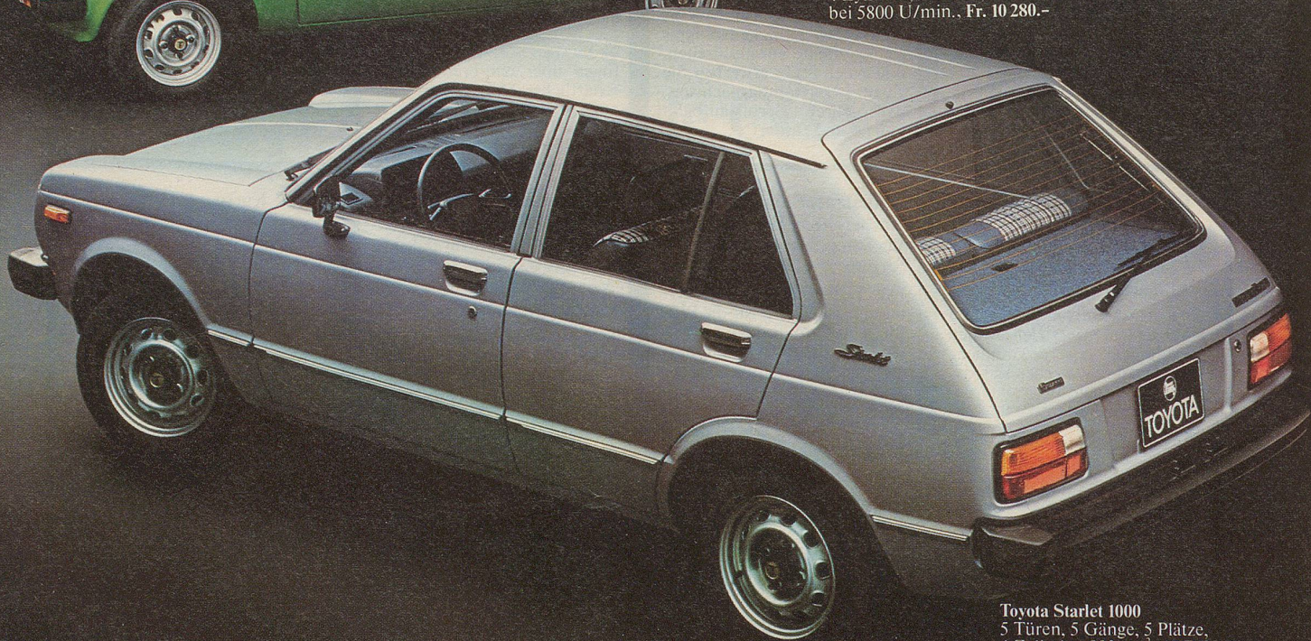
Toyota Starlet 1000 5 Türen, 5 Gänge, 5 Plätze, 4 Zylinder, 993 cm 3 , 47 DIN-PS bei 5800 U/min., Fr. 10 980.-