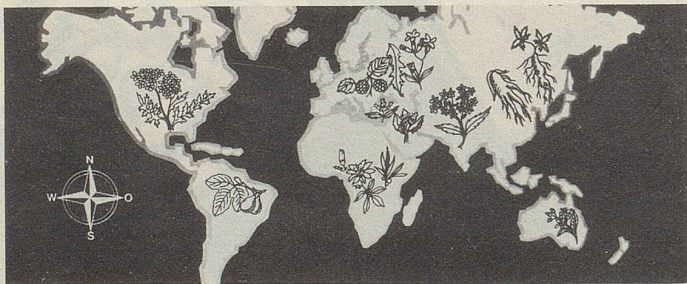
Pflanzen von allen Kontinenten in Zellers Heilmitteln.

Im Innern Afrikas gibt es Negerfürsten, denen unter schwerster Strafe jede Ortsveränderung verboten ist, es sei denn, sie werden, auf den Thron gefesselt, unter strikter Bewachung von vier Dienern herumgetragen. Fast scheint es, dass man gewissenorts solche primitive Sitten auf die Schweiz übertragen und unsere Landesväter an ihre Bürossessel im Bundeshaus binden möchte... Hans Rudolf Böckli