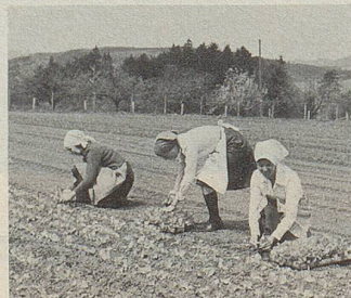
Ein Arzneipflanzenfeld wird geerntet.

Hier können Pflanzenkräfte helfen. Im Zellerbalsam sind die Säfte von