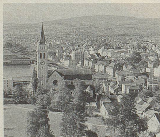
Romanshorn – hier wurden schon vor 120 Jahren rein pflanzliche Zeller-Arzneien entwickelt.

Cinnamomum aus Ceylon, Mohnblüten aus Sizilien, Guajak aus Haiti... von allen Kontinenten kommen die Pflanzen, deren Extrakten Zeller-Arzneien ihre Heilkraft verdanken. In Romanshorn werden sie zu Heilmitteln von höchster Beständigkeit verarbeitet. Bei vielen Beschwerden bewähren sie sich seit Jahren.