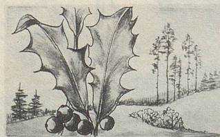
Helleborus — eine der wirksamen Heilpflanzen in Zellers Herz- und Nerventropfen.

Wer kennt das nicht: Nervöse Spannungen, Unruhe, nervöse Reizbarkeit, Wetterfühligkeit, Lampenfieber vor Examen und wichtigen Besprechungen. Gegen diese Spannungszustände gibt es eine rein pflanzliche Arznei: