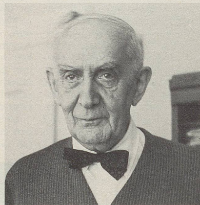
N. O. Scarpi: «Don Juans Familie»

Der vielerfahrene Autor bezeichnet sein pikantes Bändchen im Untertitel als eine Sammlung von Geschichten und Amouresken. Unserer Meinung nach dürfte die Hervorhebung der in allen sechzehn Stücken dominierenden Amouresken genügen, um die reizvollen Ausstrahlungen zu charakterisieren, die von der sublimen Erzählkunst N. O. Scarpi hervorgerufen werden und diesmal noch durch eine Reihe drastischer Zeichnungen von Helmut Knorr amüsant begleitet sind. Die amourösen Elemente werden in den einzelnen Erzählungen unter höchst verschiedenartigen Aspekten zur Geltung gebracht; ihre Grenzen sind aktives Anstürmen und passives Hineingezogenwerden der jeweiligen erotischen «Helden», deren Zugehörigkeit zur Familie des legendären Don Juan aber stets eindeutig feststeht. Immer geht es um die «irdische Glückseligkeit», die für den Verfasser des «Decamerone» so wesentlich war und auf die auch unser Autor anscheinend besonderen Wert legt. Jedenfalls ist es ihm gelungen, den Abglanz der Glückseligkeit soweit als möglich auch auf seine ihm gespannt folgenden Leser herabzusenken.