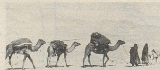
Auf „Wüstenschiffen“ werden Heilkräuter zum Hafen gebracht.

Qualität und nachweisbarer Wirksamkeit. Bei vielen Beschwerden helfen sie.