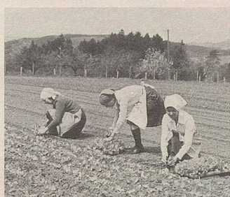
Ein Arzneipflanzenfeld wird geerntet.

Hier können Pflanzenkräfte helfen. Im Zellerbalsam sind die Säfte von