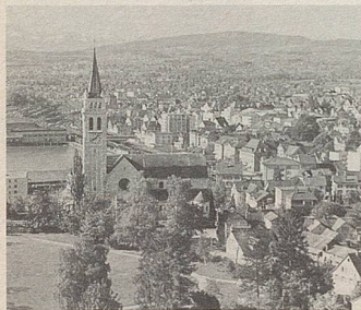
Romanshorn - hier wurden schon vor 120 Jahren rein pflanzliche Zeller-Arzneien entwickelt.

C innamomum aus Ceylon, Mohnblüten aus Sizilien, Guajak aus Haiti... von allen Kontinenten kommen die Pflanzen, deren Extrakten Zeller-Arzneien ihre Heilkraft verdanken. In Romanshorn werden sie zu Heilmitteln von höchster Beständigkeit verarbeitet. Bei vielen Beschwerden bewähren sie sich seit Jahren.