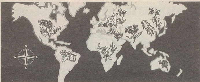
Pflanzen von allen Kontinenten in Zellers Heilmitteln.