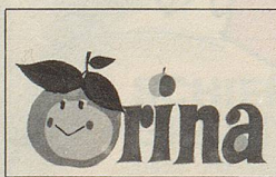
C. Schedler / J. Schedler Orina

Ein Kinderbuch auch für Erwachsene und Freunde urwüchsigen Brauchtums. Die Geschichte des «Seppli» bringt uns die verschiedenen Bräuche im Appenzellerland näher.