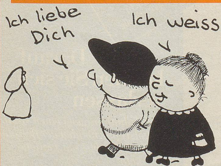
Zeichnung: Peter Kellenberger, Zürich