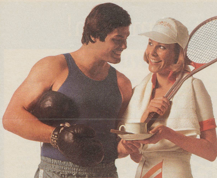
Das Schwergewicht lädt die Tennisspielerin zu einem Tässchen INCAROM ein.