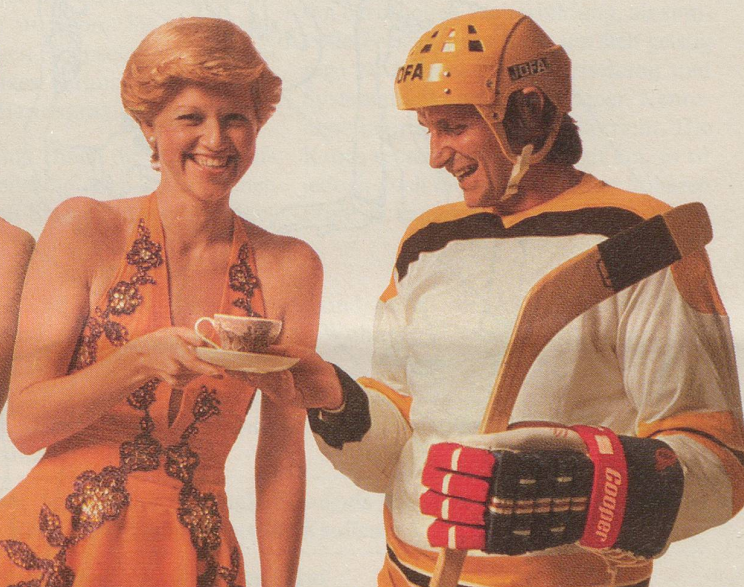
Die Tourniertänzerin lädt den Eishockeyspieler zu einem Tässchen INCAROM ein.