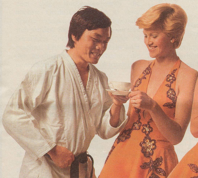
Der Karatemeister lädt die Tourniertänzerin zu einem Tässchen INCAROM ein.