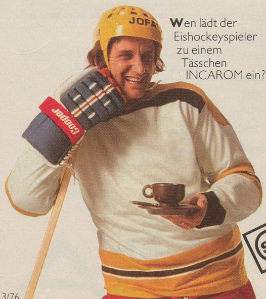
Wen lädt der Eishockeyspieler zu einem Tässchen INCAROM ein?