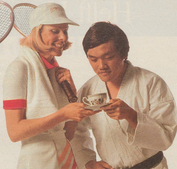
Die Tennisspielerin lädt den Karatemeister zu einem Tässchen INCAROM ein.