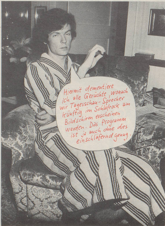
Tagesschausprecher Peter Richner

Hiermit dementiere ich alle Gerüchte, wonach wir Tagesschau-Sprecher künftig im Schlafrock am Bildschirm erscheinen werden. Das Programm ist ja auch ohne dies einschläfernd genug.