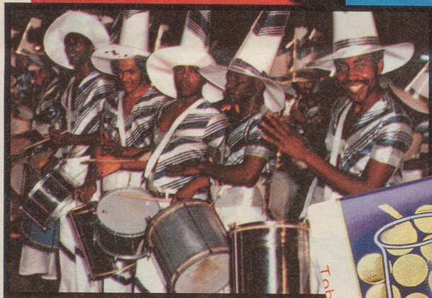
Bahia. Wo man das Lied singt «Ei, ei, ei Maria», dort wächst rassiger Kakao.

Kalifornien. Wo sich's gut leben lässt und wo feinste Trauben reifen.