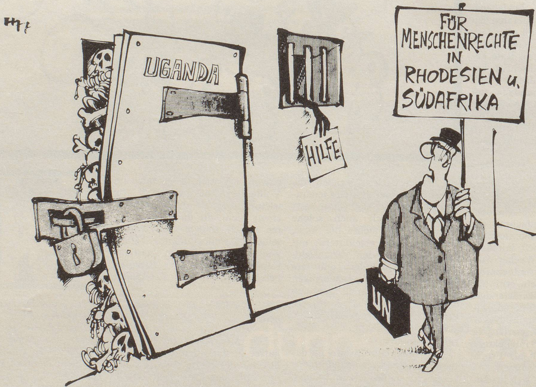
«Bedaure aufrichtig, aber ich kann mich nicht um Lappalien kümmern!»