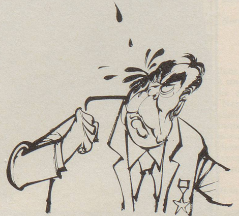
«... hat ein Brieflein im Schnabel, vom Carter einen Gruss!»