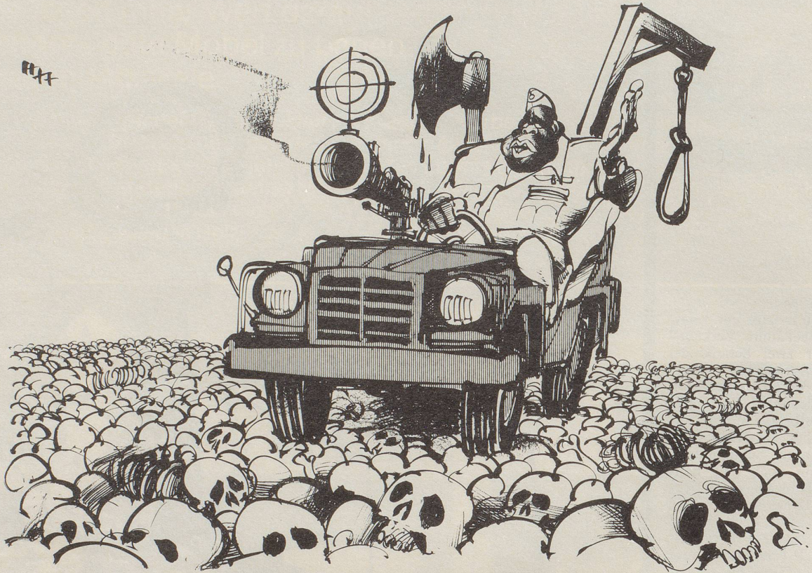
«Lauter bedauerliche Autounfälle!»