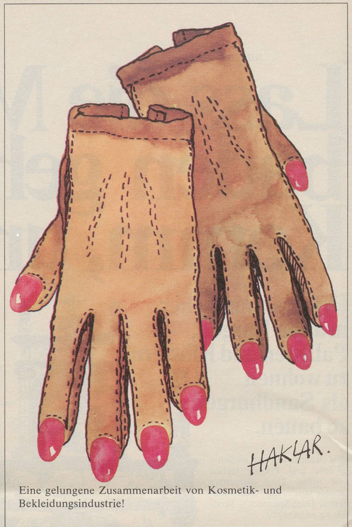
Eine gelungene Zusammenarbeit von Kosmetik- und Bekleidungsindustrie!

Ein Leser aus Berns Nähe las in seinem Leibblatt: «sda. Eine