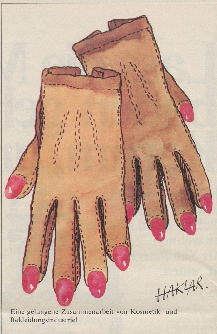
Eine gelungene Zusammenarbeit von Kosmetik- und Bekleidungsindustrie!

Ein Leser aus Berns Nähe las in seinem Leibblatt: «sda. Eine