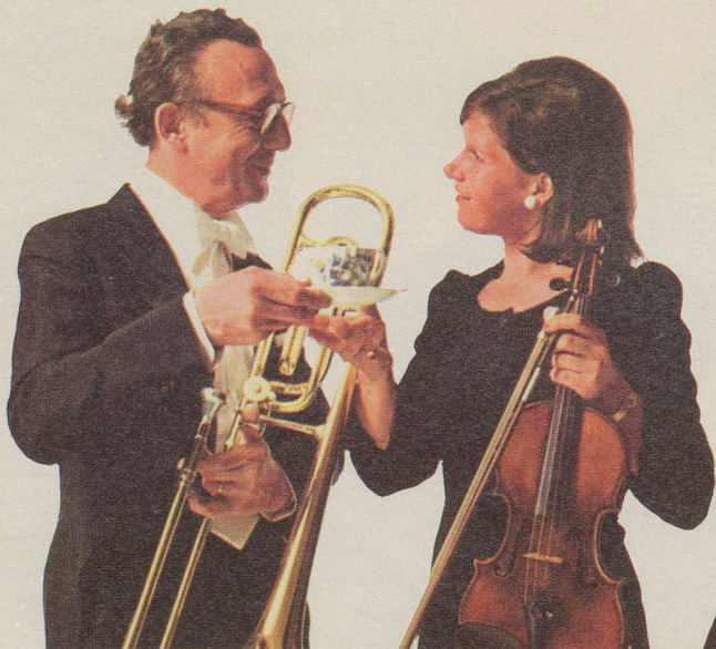
Die Posaune lädt die erste Geige zu einem Tässchen INCAROM ein.