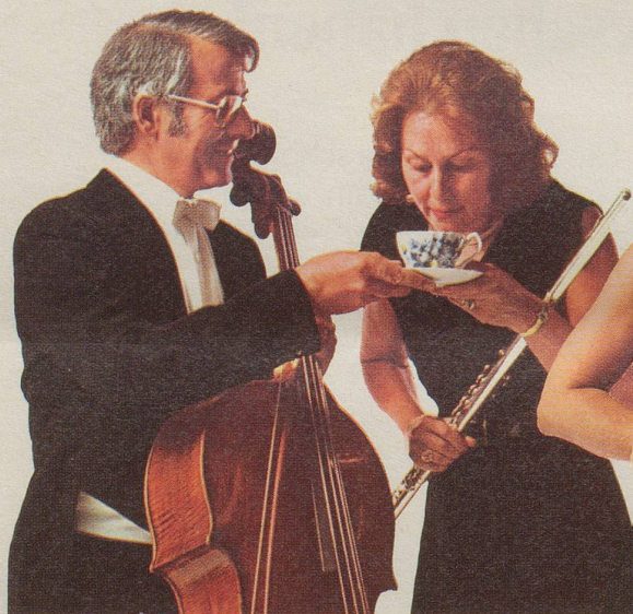
Das Cello lädt die Querflöte zu einem Tässchen INCAROM ein.