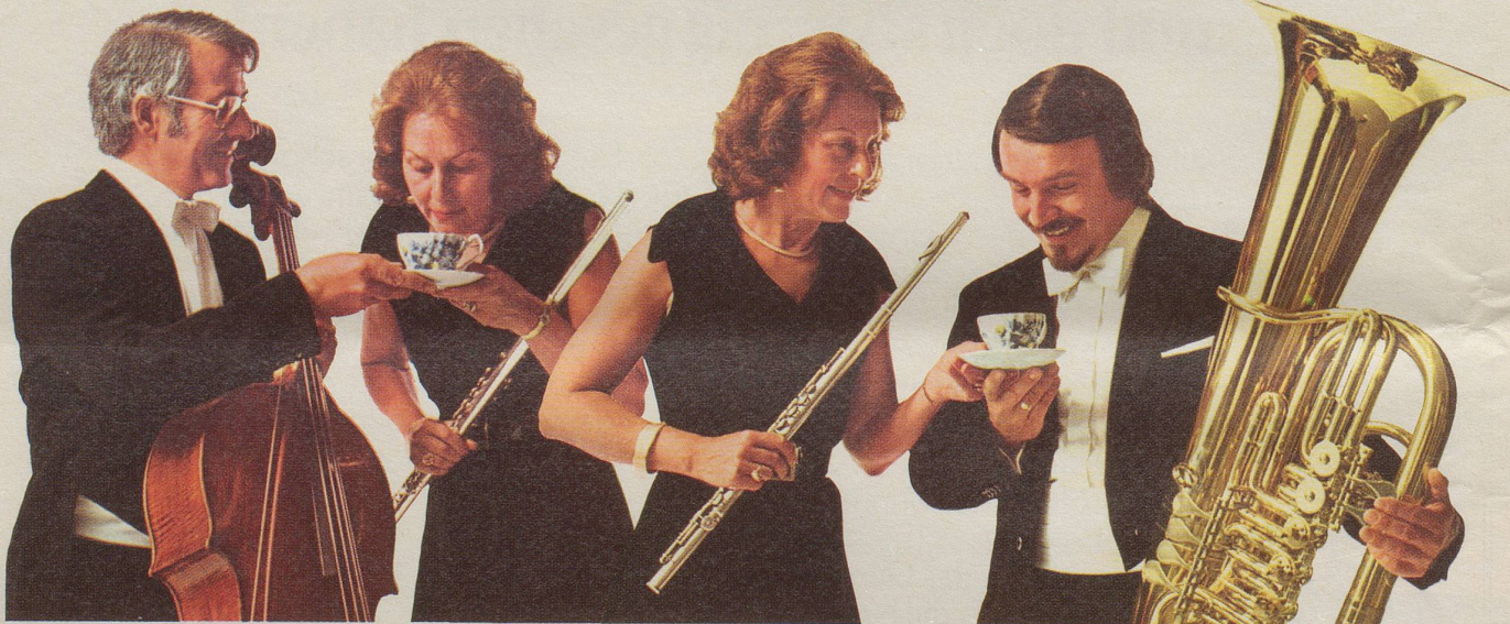
Das Cello lädt die Querflöte zu einem Tässchen INCAROM ein.