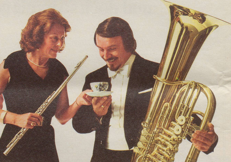
Die Querflöte lädt die Tuba zu einem Tässchen INCAROM ein.