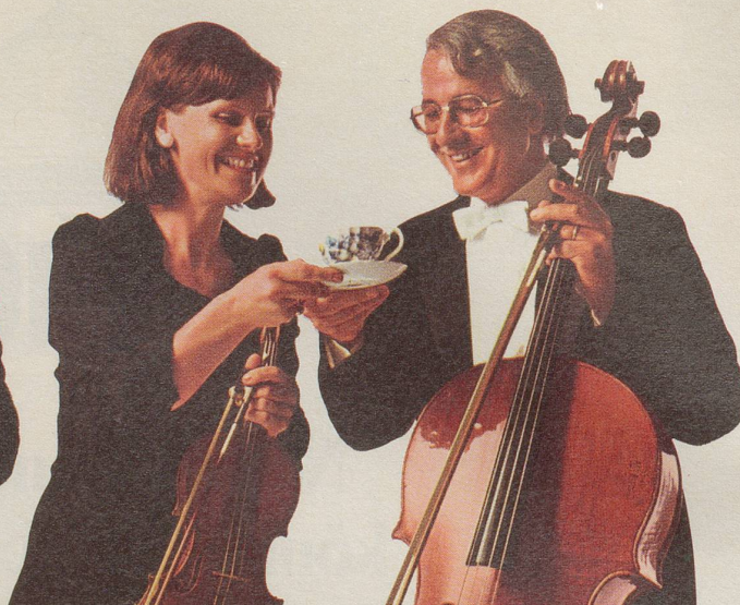
Die erste Geige lädt das Cello zu einem Tässchen INCAROM ein.