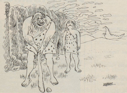
«Gib mir den andern Schläger!»