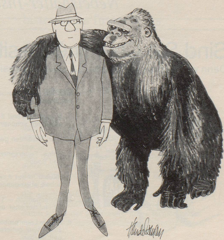
«Was sagst du, Buddy? Ich solle einen Drink holen für einen netten Artgenossen?»