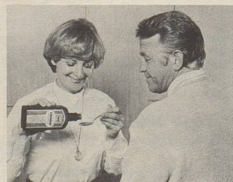
Zellerbalsam – seit über hundert Jahren das Hausmittel gegen Magen- und Darmbeschwerden.