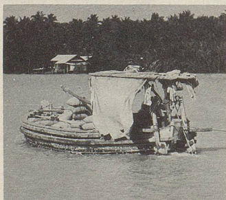
Transport von Heilpflanzen auf dem Menam (Thailand).