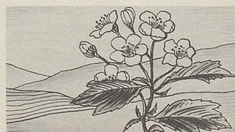
Fructus Crataegi, eine der Heilpflanzen, deren Extrakte in Zellers Herz- und Nerventropfen enthalten sind (nach Prof. Hörhammer).

Ein reines und bestens verträgliches Heilpflanzenpräparat sind auch Zellers Herz- und Nerven-Dragees . Selbst von Schwangeren können sie unbedenklich eingenommen werden, wenn die überreizten Nerven keine Ruhe finden und wenn sich erholsamer Schlaf nicht einstellen will. Weissdorn, Baldrian, Hopfen und die Passionsblume verlei-