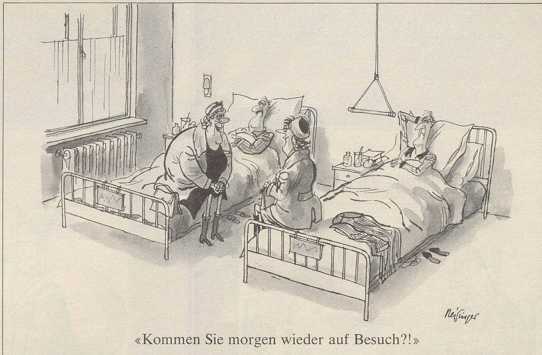
«Kommen Sie morgen wieder auf Besuch?!»

Was da mit und ohne Bewilligung oder unter dem Deckmantel «Förderung des regionalen Skitourismus» alles gesündigt wird, ist bedenklich, nicht nur im baukandalerschütterten Wallis. Unzählige Skipisten wurden in unseren Bergen in den letzten Jahren gewaltsam ausgebetet, ja selbst vor den «unantastbaren» Schutzwäldern wurde nicht haltgemacht. Dass die Natur derartige gewaltsame Eingriffe der Technik nicht «verdauen» kann, beweisen die jeweils im Frühjahr nach der Schneeschmelze