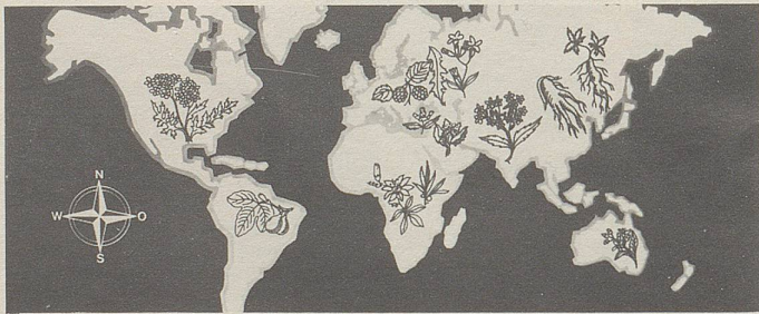
Pflanzen von allen Kontinenten in Zellers Heilmitteln.