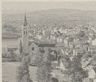
Romanshorn – hier wurden schon vor 120 Jahren rein pflanzliche Zeller-Arzneien entwickelt.

C innamomum aus Ceylon, Mohnblüten aus Sizilien, Guajak aus Haiti ... von allen Kontinenten kommen die Pflanzen, deren Extrakten Zeller-Arzneien ihre Heilkraft verdanken. In Romanshorn werden sie zu Heilmitteln von höchster Beständigkeit verarbeitet. Bei vielen Beschwerden bewähren sie sich seit Jahren.