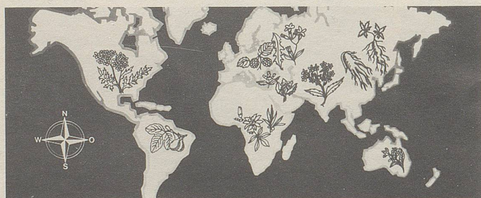
Pflanzen von allen Kontinenten in Zellers Heilmitteln.