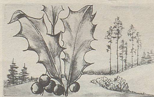
Ilex — eine der wirksamen Heilpflanzen in Zellers Herz- und Nerventropfen.

Wer kennt das nicht: Nervöse Spannungen, Unruhe, nervöse Reizbarkeit, Wetterfühligkeit, Lampenfieber vor Examen und wichtigen Besprechungen. Gegen diese Spannungszustände gibt es eine rein pflanzliche Arznei: