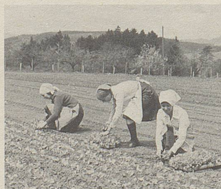
Ein Arzneipflanzenfeld wird geerntet.

Hier können Pflanzenkräfte helfen. Im Zellerbalsam sind die Säfte von