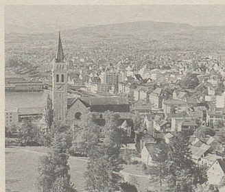
Romanshorn – hier wurden schon vor 120 Jahren rein pflanzliche Zeller-Arzneien entwickelt.

C innamomum aus Ceylon, Mohnblüten aus Sizilien, Guajak aus Haiti ... von allen Kontinenten kommen die Pflanzen, deren Extrakten Zeller-Arzneien ihre Heilkraft verdanken. In Romanshorn werden sie zu Heilmitteln von höchster Beständigkeit verarbeitet. Bei vielen Beschwerden bewähren sie sich seit Jahren.