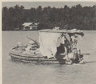
Transport von Heilpflanzen auf dem Menam (Thailand).

Unseren Magen sollten wir eigentlich nie spüren. Auch der Darm sollte unauffällig arbeiten. Rebliert aber der Magen nach dem Essen durch Aufstoßen, Völlegefühl, Übelkeit, dann bewährt sich Zellerbalsam . Die Extrakte von zwölf Heilpflanzen aus vier Erdteilen sind in ihm enthalten. Sie wirken krampflösend, beruhigen die gereizten Schleimhäute und fördern die Sekretion der Verdauungssäfte. Jetzt auch in Tablettenform erhältlich.