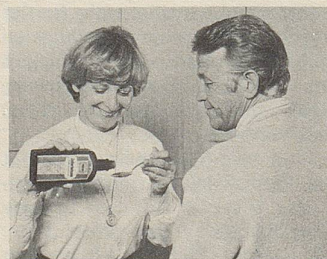
Zellerbalsam – seit über hundert Jahren das Hausmittel gegen Magen- und Darmbeschwerden.