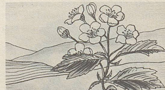
Fructus Crataegi, eine der Heilpflanzen, deren Extrakte in Zellers Herz- und Nerventropfen enthalten sind (nach Prof. Hörhammer).

Naturkräfte der Pflanzen werden auch wohltuend aktiv bei Herzklopfen, raschem Puls, Beklemmungsgefühl, bei Nervosität, Reizbarkeit und Atemnot. So verdanken Zellers Herz- und Nerventropfen ihre Heilerfolge unter anderem Extrakten aus Blüten, Blättern und Früchten des Crataegus (Weissdorn). Zellers Herz- und Nerventropfen besänftigen die gereizten Nerven und lassen das Herz wieder ruhiger schlagen.