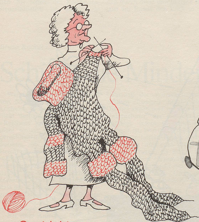
Gestrickt von oben bis unten