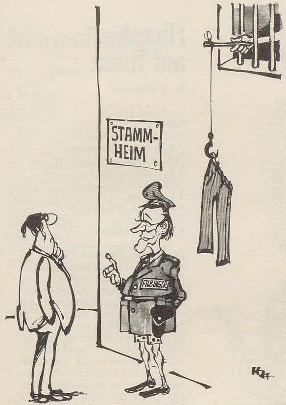
«... Die Bonner Regierung sollte in der Terrorbekämpfung endlich einmal auf mich und meine Freunde hören.»