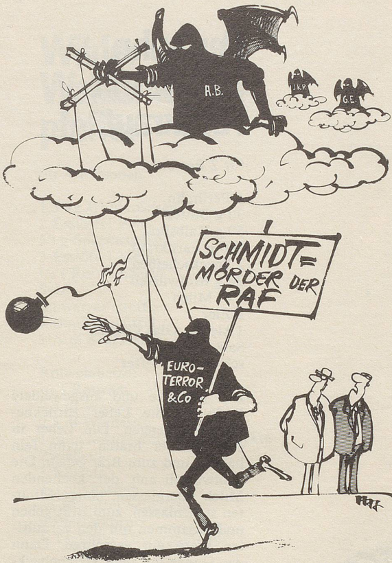
«... Aber technisch begabt ist er, dieser Baader ...»