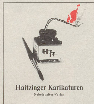
Haitzinger Karikaturen Nebelspalter-Verlag