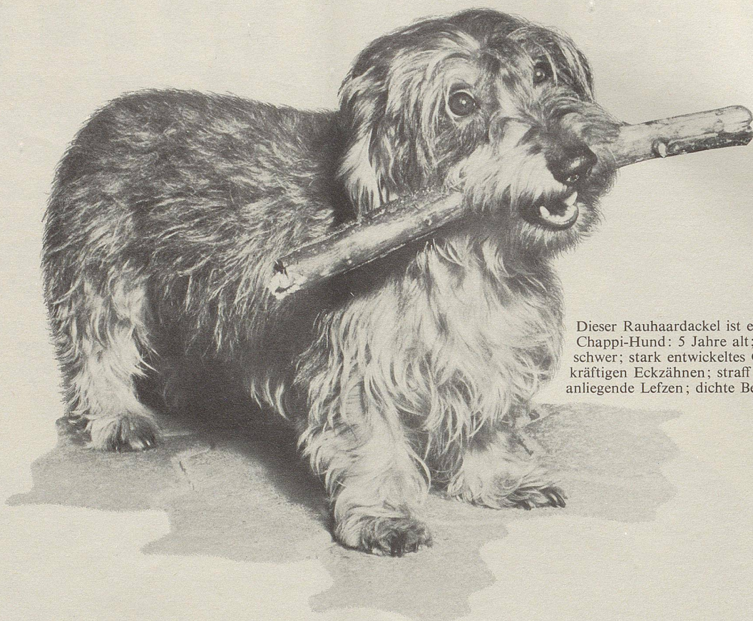
Dieser Rauhaardackel ist ein typischer Chappi-Hund: 5 Jahre alt; 5½ kg schwer; stark entwickeltes Gebiss mit kräftigen Eckzähnen; straff am Kiefer anliegende Lefzen; dichte Behaarung.