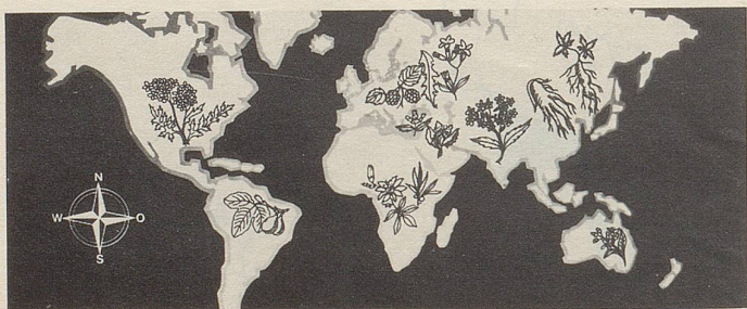
Pflanzen von allen Kontinenten in Zellers Heilmitteln.

Das Schweizer Bier-Quiz exklusiv im Nebelspalter