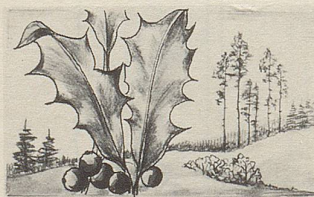
Ilex — eine der wirksamen Heilpflanzen in Zellers Herz- und Nerventropfen.

Wer kennt das nicht: Nervöse Span- nungen, Unruhe, nervöse Reizbarkeit, Wetterfühligkeit, Lampenfieber vor Examen und wichtigen Besprechungen. Gegen diese Spannungszustände gibt es eine rein pflanzliche Arznei: