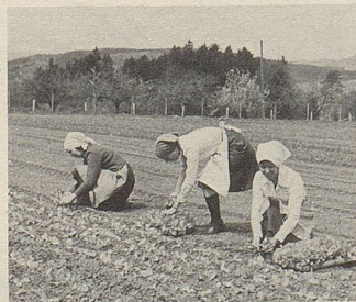
Ein Arzneipflanzenfeld wird geerntet.

Hier können Pflanzenkräfte helfen. Im Zellerbalsam sind die Säfte von